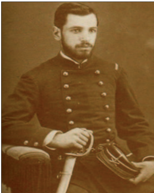
Ricardo Prat Chacón en el Ejército de Chile, desde 1880 a 1884.

Antofagasta contra el bombardeo de la escuadra peruana el 29 de agosto del mismo año.